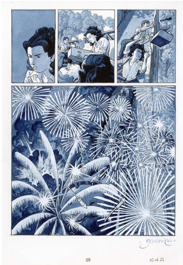
Planche originale 103 de Madeleine, Résistante , tome 3 - Les nouilles à la tomate Éditions Dupuis, 2024 / Éditions Barbier, 2024 Encre de Chine et aquarelle sur papier 18 x 26 cm Signée ↴