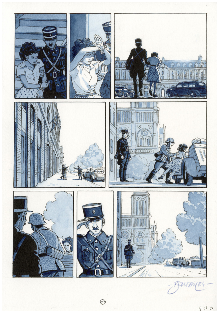
Planche originale 29 de Madeleine, Résistante , tome 3 - Les nouilles à la tomate Éditions Dupuis, 2024 / Éditions Barbier, 2024 Encre de Chine et aquarelle sur papier 18 x 26 cm Signée ↴