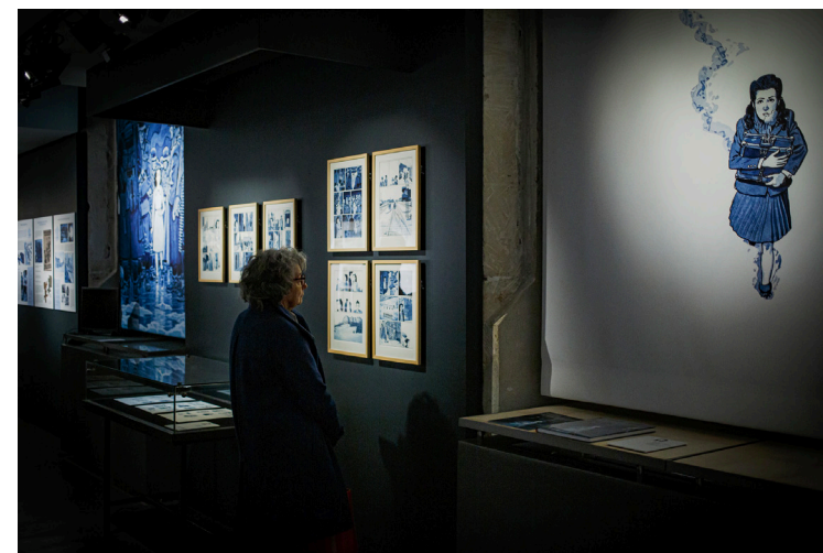
Image : Exposition Madeleine Riffaud, Résistante au Centre d'Histoire de la Résistance et de la Déportation, Lyon (FR) 2023

Passée | Exposition Dominique Bertail : Madeleine, Résistante. Galerie Barbier, Paris (FR) - 08 octobre 2021 au 06 novembre 2021