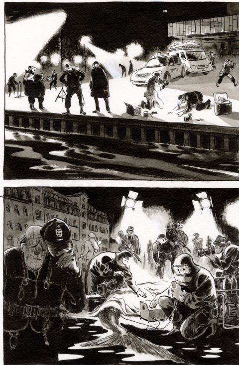
Planche originale 44 de Copenhague Éditions Dargaud, 2024 Encre de Chine sur papier 30 x 40 cm Signée ↵