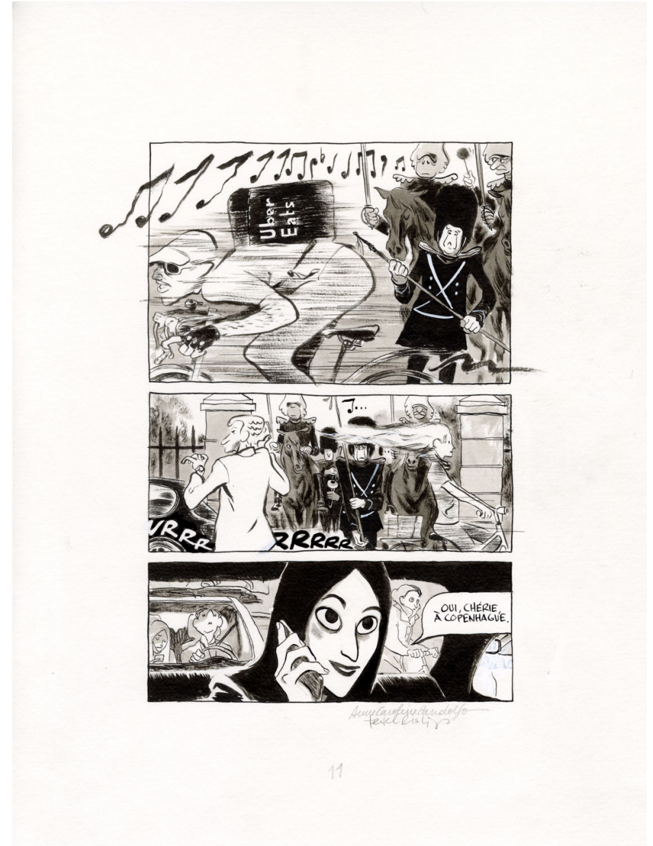
Planche originale 11 de Copenhague Éditions Dargaud, 2024 Encre de Chine sur papier 30 x 40 cm Signée ↳

L'exposition présentera un ensemble de planches et d'illustrations originales réalisées à l'encre de Chine.