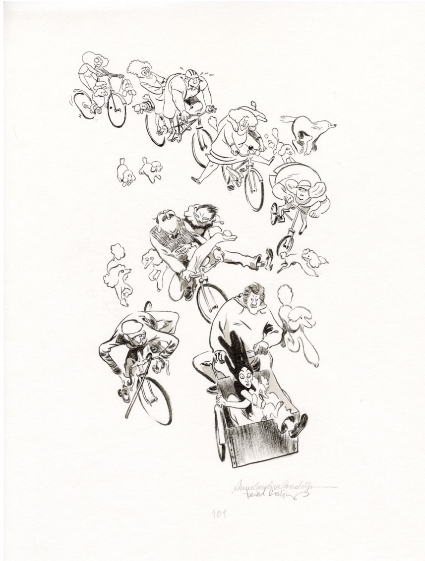
Planche originale 101 de Copenhague Éditions Dargaud, 2024 Encre de Chine sur papier 30 x 40 cm Signée ↴